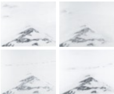
Von links nach rechts: AL2007.023, AL2007.022 AL2007.021, AL2007.020