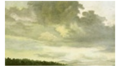
Pierre-Henri de Valenciennes, Berg über dem Nemi-See, 1782–1784, Öl auf Papier auf Karton, 24 × 31 cm, Paris, Musée du Louvre