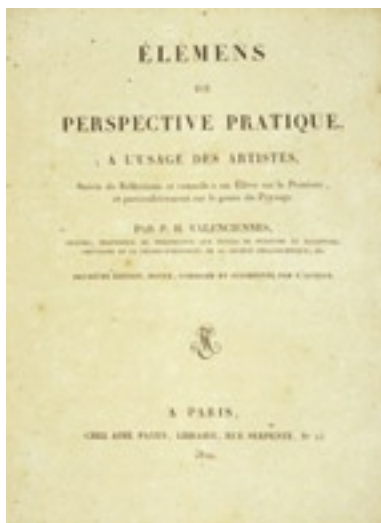
Pierre-Henri de Valenciennes, Titelblatt, 1820

Vieles scheint darauf hinzuweisen, dass um 1800 die Darstellung der flüchtigen Naturphänomene eine wachsende Anerkennung findet und sich als Gattung etabliert. Bereits gegen Ende des 18. Jahrhunderts hielten kleinformatige Landschaftsstudien Einzug in den offiziellen Ausstellungsbetrieb der französischen Salons. 3 Hat bereits um die Jahrhundertwende die Naturerscheinung eine autonome Stellung gegenüber dem Modell der klassischen Landschaftskomposition, der zeitlosen, idealen Landschaft Arkadiens eingenommen? Der Landschaftsmaler Pierre-Henri de Valenciennes publizierte 1800 die umfangreiche Schrift Elémens [sic] de perspective pratique à l'usage des artistes, suivis de réflexions et conseils à un élève sur la peinture et particulièrement sur le genre du paysage . Bereits 1803 fand das Werk auch in einer deutschen Übersetzung Verbreitung. 4