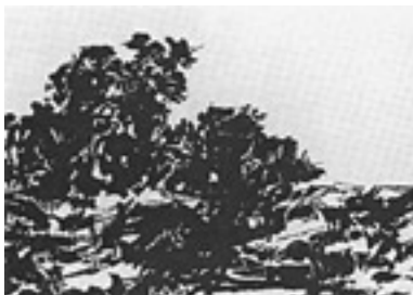
Alexander Cozens, Ink-Blot Landscape, 1785, Aquatinta, 24 × 31,5 cm, London, Tate Gallery

Geht man der Entwicklung des Flecks in der Kunsttheorie nach, so findet sich die Geschichte einer doppelten Potenz. Denn wir vermögen im Fleck das perfekte Abbild manches komplexen Phänomens, der komplexen Ordnung des Zufälligen zu erkennen, den Fall eines Kleides, die Formation von Wolken, Wellen oder Schneefeldern. Auf der ande-