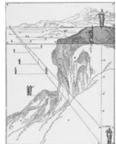
Pierre-Henri de Valenciennes, Perspektivische Grössenabstufung von Figuren verteilt in einer Landschaft, abgebildet in: Pierre-Henri de Valenciennes, Praktische Anleitung zur Linear- und Luftperspectiv [sic] für Zeichner und Mahler. Nebst Betrachtungen über das Studium der Malerey überhaupt, und der Landschaftsmalerey insbesondere , Hof: Grau 1803, Tf. XXXV